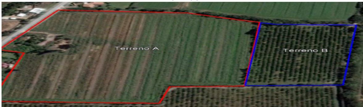
Imagen N° 1: Imagen satelital de los predios adquiridos por la Municipalidad de Doñihue.