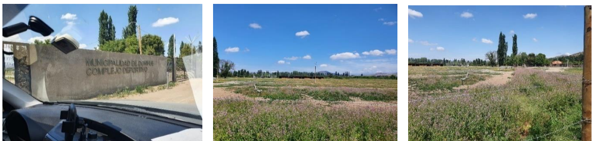
Imagen N° 2: Terreno “A”