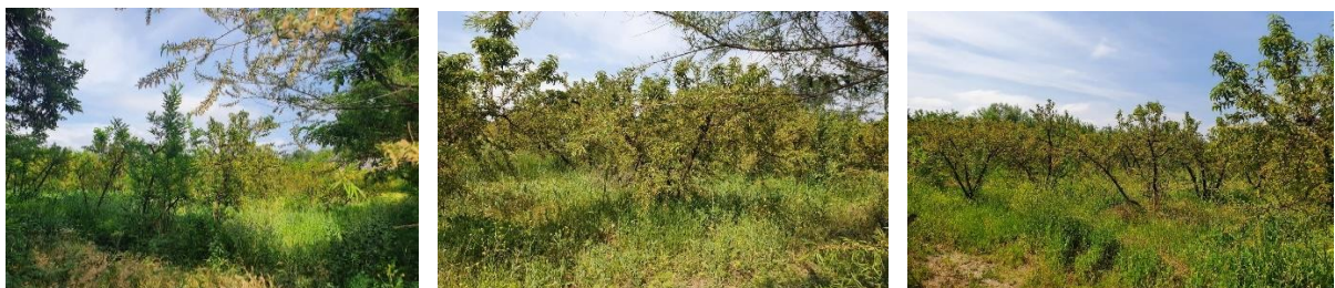
Imagen N° 3: Terreno "B"